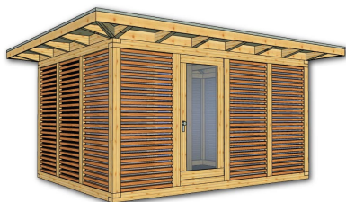
(1) Lärchen-Rhombusprofil-System – blickdicht als Wandsystem wie oben beschrieben