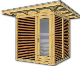
Artikel: K200 – 338×338 cm inkl. 50 cm Dachüberstand je Seite Preis: 10.990,- € inkl. 19% MwSt. Fracht und Montage auf Anfrage