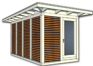
Artikel: K202 – 562×338 cm inkl. 50 cm Dachüberstand je Seite Preis: 14.490,- € inkl. 19% MwSt. Fracht und Montage auf Anfrage