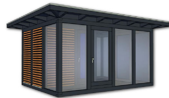
Artikel: K205 – 562×450 cm inkl. 50 cm Dachüberstand je Seite Preis: 17.490,- € inkl. 19% MwSt. Fracht und Montage auf Anfrage