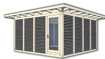
Artikel: K207 – 562×562 cm inkl. 50 cm Dachüberstand je Seite Preis: 20.490,- € inkl. 19% MwSt. Fracht und Montage auf Anfrage