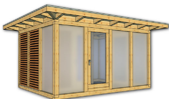
Artikel: K206 – 562×450 cm inkl. 50 cm Dachüberstand je Seite Preis: 17.490,- € inkl. 19% MwSt. Fracht und Montage auf Anfrage