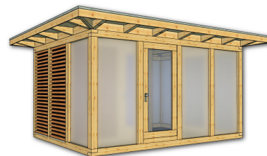
(3) Isolierglas 24 mm mit milchig-weiß oder bronzefarben getönten Scheiben

(4) Gegen Aufpreis können auch Rhombusprofil-Leisten in Kombination vor die Isolierverglasung gesetzt werden.