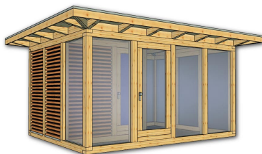
(2) Isolierglas 24 mm transparent