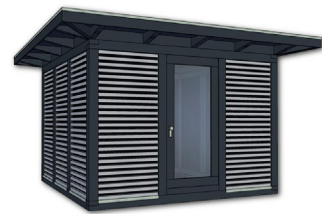
Artikel: K203 – 450×450 cm inkl. 50 cm Dachüberstand je Seite Preis: 15.490,- € inkl. 19% MwSt. Fracht und Montage auf Anfrage