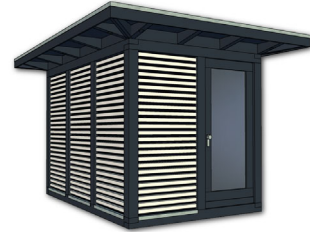
Artikel: K201 – 450×338 cm inkl. 50 cm Dachüberstand je Seite Preis: 12.490,- € inkl. 19% MwSt. Fracht und Montage auf Anfrage